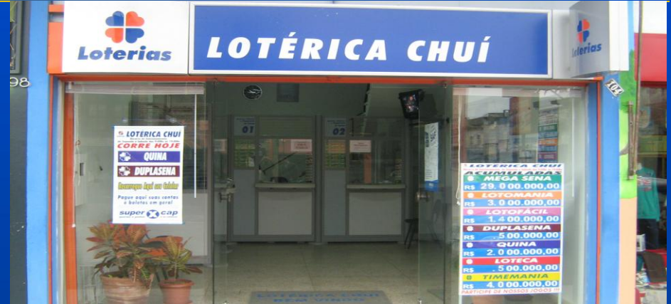
UL Chuí / RS