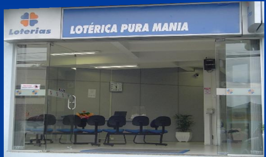
UL Brasília/ DF